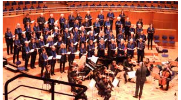
Polizei-Chor Düsseldorf 1958 e.V. mit Orchester in der Tonhalle