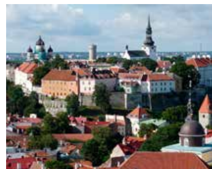
Blick auf die Altstadt von Tallinn