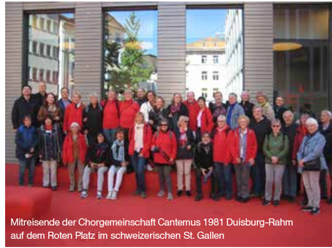
Mitreisende der Chorgemeinschaft Cantemus 1981 Duisburg-Rahm auf dem Roten Platz im schweizerischen St. Gallen

Ein weiteres Glanzlicht des Tages ist eine Fahrt mit dem Dampfbus der