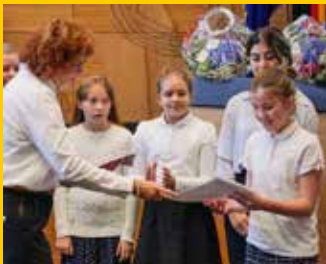
Ehrungen von Sängerinnen und Sängern