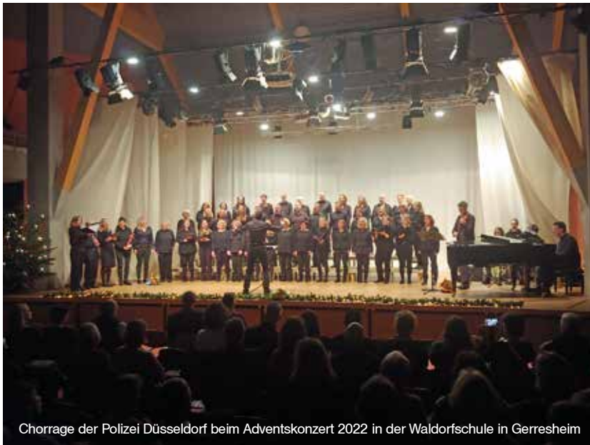
Chorrage der Polizei Düsseldorf beim Adventskonzert 2022 in der Waldorfschule in Gerresheim

Seit diesem Jahr proben wir inzwischen weitgehend normal, können Anfragen für Auftritte annehmen und bereiten uns voller Vorfreude auf unser nächstes Sommerkonzert vor. Dieses ist für den 1. September 2023 in der Rudolf Steiner Schule in Düsseldorf-Gerresheim geplant. Als Gastchor ist der PolizeiFrauenChor Köln e.V. dabei. Wir hoffen, viele Gäste begrüßen zu dürfen! //