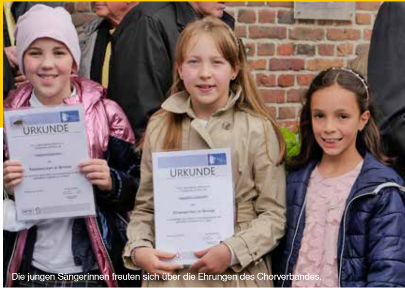
Die jungen Sängerinnen freuen sich über die Ehrungen des Chorverbandes.