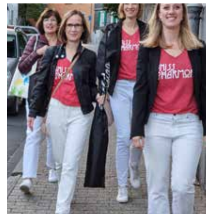
Sängerinnen von MissHarmony auf dem Weg zum Kino

Unser Dank gilt dem Weltspiegel-Kino Mettmann, das es uns ermöglicht hat, diesen Film über unser liebstes Hobby zu begleiten. Der Film hat uns sehr berührt und – falls das überhaupt geht – noch mehr motiviert. //