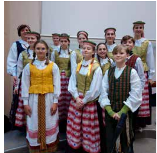
Junges Zither-Ensemble in litauischen Trachten