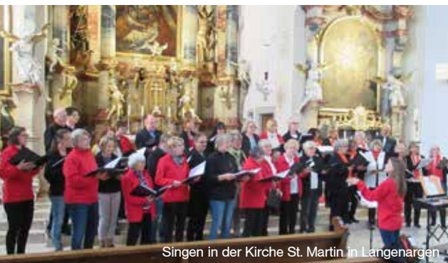
Singen in der Kirche St. Martin in Langenargen

U nsere gemischter Chor wurde im Jahr 2021 vierzig Jahre alt. Coronabedingt konnte die übliche Jubiläumsreise aber erst im September 2022 stattfinden. Nach Rom, Budapest, Salzburg und Thüringen war diesmal der malerische Bodensee das Ziel unserer aktiven und passiven Mitglieder, und keiner wurde enttäuscht!