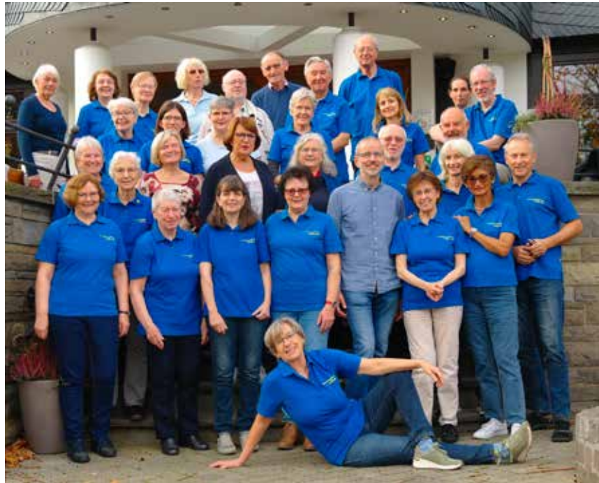
Madrigalchor Millrath beim Probenwochenende Ende Oktober 2022 im Sauerland

Apropos Adventskonzert. Nach drei Jahren Abstinenz fand diese allseits beliebte Veranstaltung am Vorabend des dritten Sonntags im Advent in der gut besetzten Kirche Sankt Franziskus statt. Die konzentrierte Probenarbeit am Montagabend sowie das intensive Probenwochenende in einem Hotel im Sauerland Ende Oktober trugen sicher zu dem schönen und erfolgreichen Konzert bei.