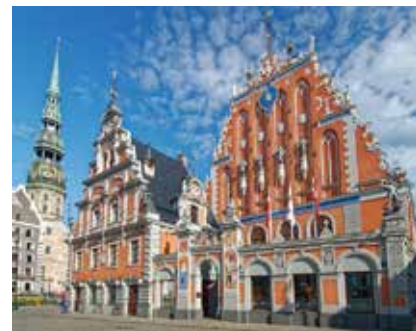
Schwarzhäupterhaus in Riga