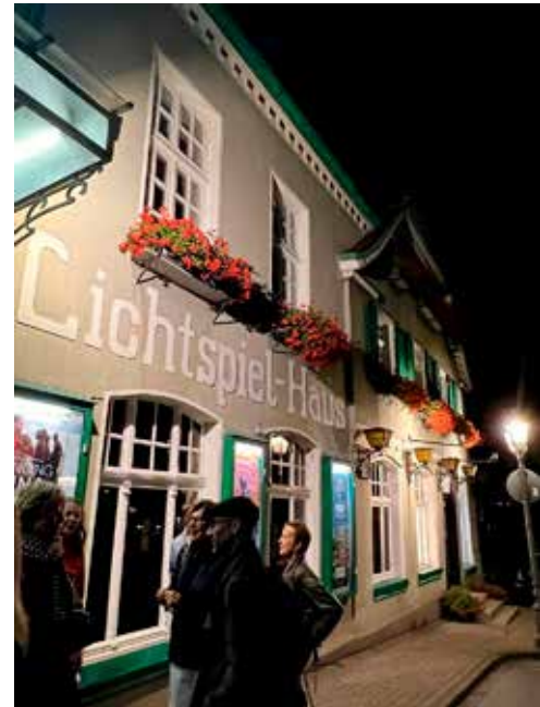
Weltspiegel-Kino in Mettmann