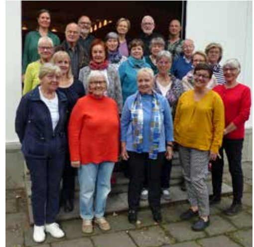
Teilnehmer*innen an der Chorverbandsreise ins Baltikum